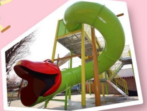
ループスライド 無料