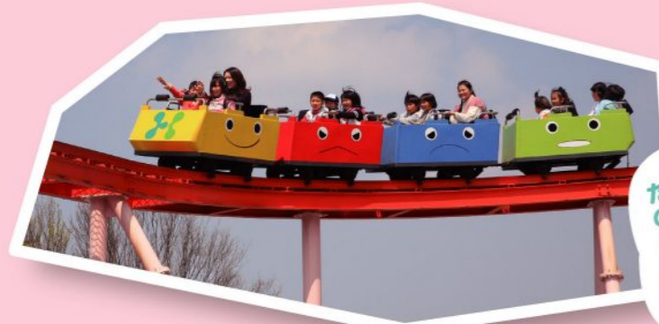
FP ミニジェットコースター 250円