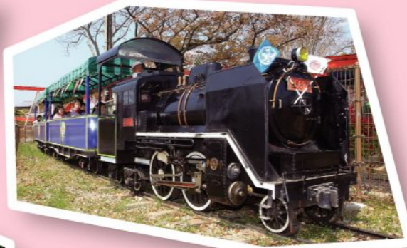
FP SL(汽車) 250円