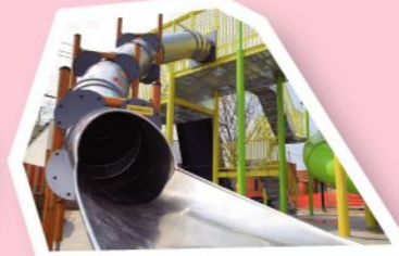
キューブスライド 無料