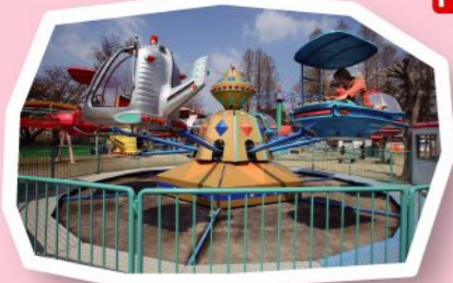
FP アポロスター 250円