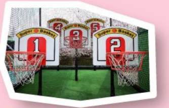
スーパーバスケット 100円