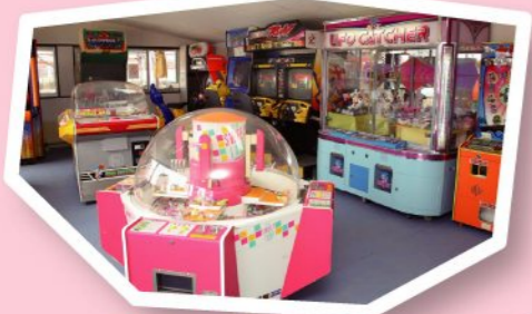
ゲームコーナー 100円