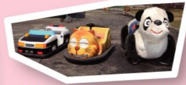
動物車 100円 200円