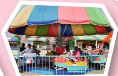
FP スペースカー 200円