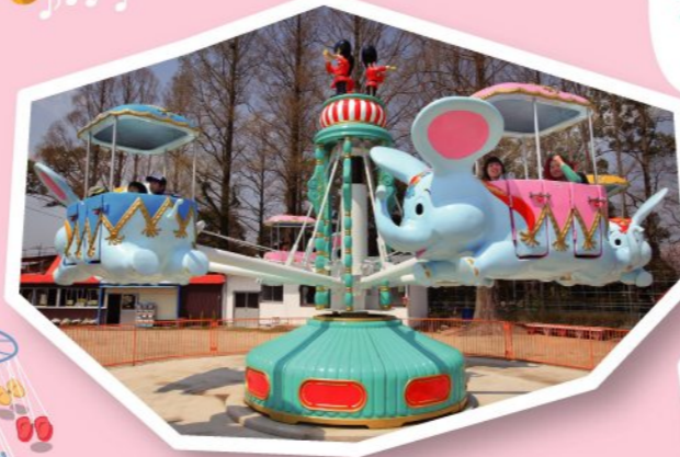
FP スカイダイバー 250円