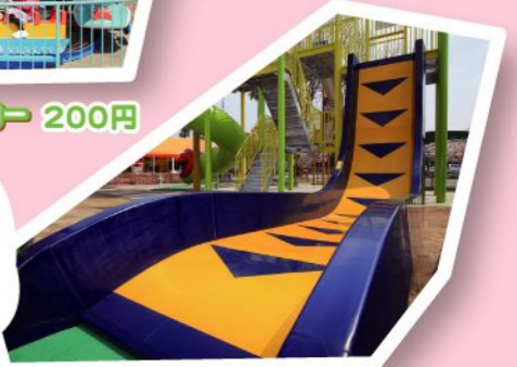
クライムスライド 無料