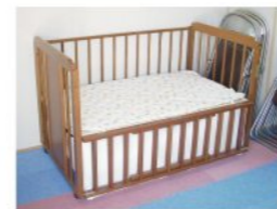
ベビールーム(授乳室)