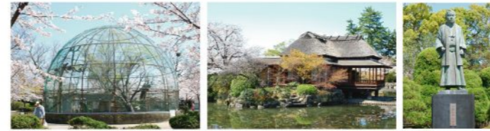
小動物園 隔林亭 江藤新平像

神野公園は、弘化3年(1846年)に佐賀藩主鍋島直正公の別邸として造られ、神野のお茶屋と呼ばれていました。今では佐賀市内唯一のこども遊園地、小動物とのふれ合いが楽しい小動物園、そして公園内に約1000本・多布施川沿いに約3000本ある桜並木が美しく、桜の名所として市民の憩いの場となっています。また、四季の植物が美しい日本庭園とすいれん池や洋式庭園もあり、自然とのふれ合いも楽しめます。園内には幕末から明治初期にかけて西郷隆盛とともに活躍した江藤新平の銅像もあります。