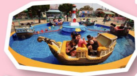
FP 回転ボート 200円