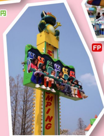
FP フロッグジャンピング 250円